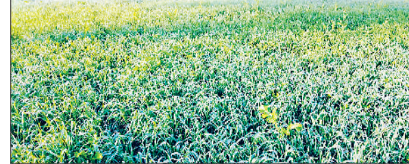
रेवाड़ी। एक किसान के खेत में खड़ी गेहूं की फसल।

दिसंबर के अंत में कड़ाके की ठंड दस्तक देने जा रही है। दिन के समय तेज धूप से अभी कड़ाके की ठंड से बचाव हो रहा है। तापमान में गिरावट आने से रात के समय ठंड कंपकंपी छुड़ाने लगी है। इस सीजन में वीरवार की रात सबसे ठंडी रही। दिन के तापमान में भी तेज धूप के बावजूद गिरावट दर्ज की गई है। शनिवार को आसमान में आंशिक बादल छा सकते हैं। कोहरे से अभी तक निजात मिली हुई है, जिससे सूखी ठंड के कारण पाला जल्द देखने को मिल सकता है। शुक्रवार को अधिकतम