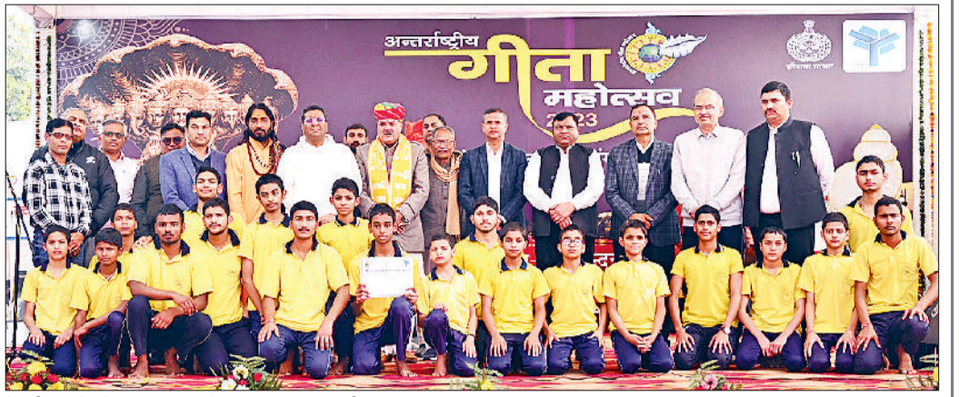
रेवाड़ी। बच्चों को सम्मानित करते विधायक व अधिकारी।