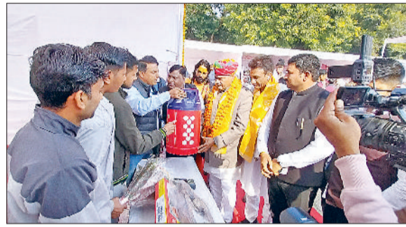
रेवाड़ी। शंखनाद से महोत्सव का शुभारंभ करते आचार्य व खाद्य एवं आपूर्ति विभाग की स्टॉल का अवलोकन करते विधायक।

विधायक व अन्य गणमान्य व्यक्तियों ने सांस्कृतिक मंच से गीता पूजन करते हुए दीप प्रज्वलन कर गीता जयंती महोत्सव गरिमायुगी ढंग से शुभारंभ किया। गीता महोत्सव-2023 पूर्ण रूप से गीता के 18 अध्यायों व प्रदत्त शिक्षाओं पर आधारित है, जिससे आमजन को गीता पर आधारित बेहतरीन प्रस्तुति सांस्कृतिक मंच से देखने को मिल रही है।