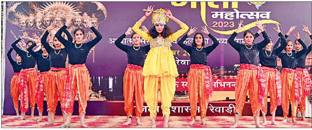
रेवाड़ी। महोत्सव में कार्यक्रम की प्रस्तुति देती छात्राएं।