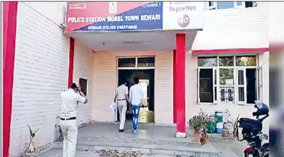
रेवाड़ी। पुलिस स्टेशन मॉडल टाउन।