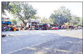
रेवाड़ी। गांव मसानी का बस स्टैंड।

नाहड़। गांव नाहड़ में लंबे समय से झुका हुआ बिजली का पोल अचानक गिर गया। आसपास किसी व्यक्ति के नहीं होने से हादसा टल गया। नाहड़ की घमंडी वाली कुई के पास एक प्लाट में लगा बिजली का पुराना पोल काफी दिनों से झुका हुआ था। ग्रामीणों ने किसी अनहोनी होने से पूर्व बिजली निगम को इस हादसे की गुहार लगाई थी। ग्रामीणों के बार-बार आग्रह करने के बावजूद भी बिजली का पोल नहीं हटाया गया।