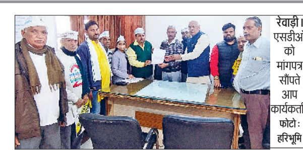
रेवाड़ी। एसडीओ को मांगपत्र सौंपते आए कार्यकर्ता।

उनके जीवन पर आधारित लघु नाटिका प्रस्तुत की गई। प्राचार्या ने सभी विद्यार्थियों के उज्वल भविष्य की कामना की।