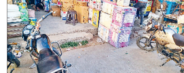
रेवाड़ी। नाले पर किया गया अतिक्रमण।

नगरपालिका के अधिकारियों को जानकारी होने के बावजूद भी नाले पर अवैध कब्जा करने वालों के खिलाफ कार्रवाई नहीं की जा रही है। अवैध कब्जा होने के कारण नाले की सफाई तक नहीं हो रही है। धारुहेड़ा के भगत सिंह चौक से सोहना-रेवाड़ी रोड, दिल्ली रोड