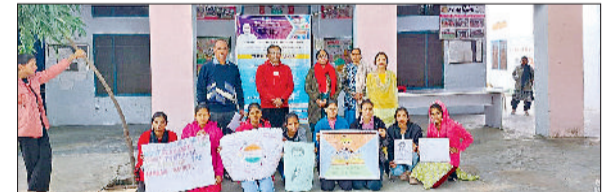
रेवाड़ी। विजेता छात्राएं शिक्षकों के साथ।