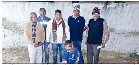
रेवाड़ी। एएसएनसीबी टीम की गिरफ्तार में स्मैक बेचने का आरोपी

वाले व्यक्ति को अपनी आईडी दिखानी होगी। बिना आईडी के रुकने की अनुमति नहीं होगी। बावल नगर पालिका सेक्रेटरी ने बताया कि रैन बसेरे में रुकने वाले व्यक्तियों के लिए बिजली व पानी की व्यवस्था कर दी गई है। रैन बसेरे में पलंग लगाने के साथ रजाई, गद्दे व कंबल की व्यवस्था पूरी कर दी गई है।