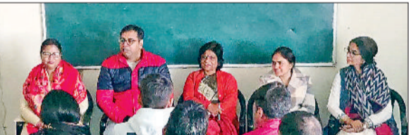
रेवाड़ी। विद्यार्थियों को जानकारी देते शिक्षक।