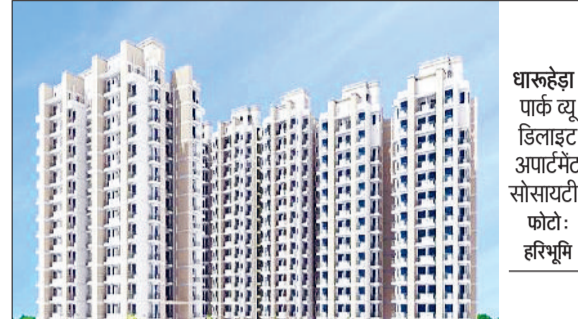
धारुहेड़ा। पार्क व्यू डिलाइट अपार्टमेंट सोसायटी।