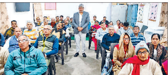
रेवाड़ी। ट्रेनिंग सेंटर का निरीक्षण करते हुए पर्यवेक्षक।