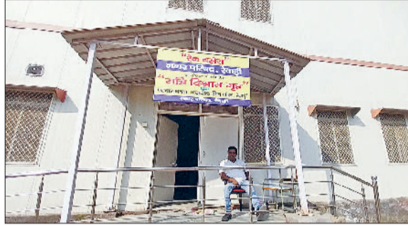
रेवाड़ी। पटवार भवन के रैन बसेरे में गेट पर बैठा कर्मचारी, रैन बसेरे के कमरे में पलंग व रजाई-गद्दे की व्यवस्था, बावल में खुला हुआ रैन बसेरा।

आगामी दिनों में बढ़ती ठंड को देखते हुए नगर परिषद की ओर से रैन बसेरों में पूरी व्यवस्था कर दी गई है। रैन बसेरों में रोजाना 8 से 10 लोग ठहरने के लिए भी आ रहे हैं। हालांकि इस बार अभी तक कड़ाके की ठंड नहीं पड़ी है। तापमान में लगातार उतार-चढ़ाव जारी है। दिसंबर माह खत्म होने जा रहा है। जनवरी माह में तापमान में गिरावट आने पर असहाय लोगों को रैन बसेरों की ज्यादा जरूरत पड़ने वाली है। बस स्टैंड व पटवार में स्थित रैन बसेरों में नगर परिषद की ओर से कर्मचारी लगाए गए हैं ताकि आश्रय लेने के लिए आने वाले लोगों को परेशानी न उठानी पड़े। प्रति वर्ष प्रशासन की ओर से रैडक्रास सोसायटी व अन्य