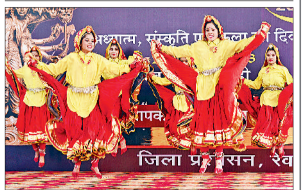
रेवाड़ी। महोत्सव में डॉस पेश करती छात्राएं।